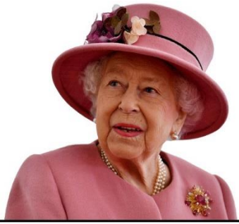
نویسنده: سارا زارع